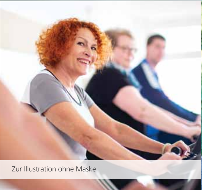
Zur Illustration ohne Maske